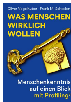
Cover und 3D: „Was Menschen wirklich wollen“